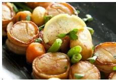
帆立のソテー 和風醤油仕立て Sサイズ ¥4,400 Lサイズ ¥7,700