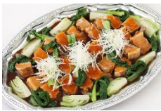
広東風豚肉のやわらか煮 Sサイズ ¥3,300 Lサイズ ¥5,500