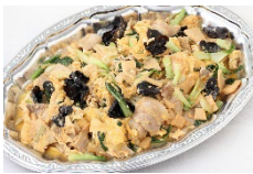
ムーシーロー(豚肉ときくらげの卵炒め) Sサイズ ¥3,300 Lサイズ ¥5,500