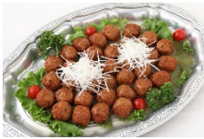
肉団子の甘酢あんかけソース Sサイズ ¥2,750 Lサイズ ¥4,400