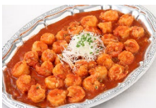
海老のチリソース Sサイズ ¥3,850 Lサイズ ¥6,600