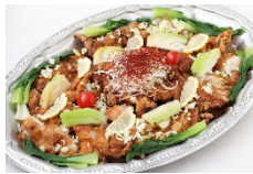
若鶏のから揚げ 甘酢ソース Sサイズ ¥3,300 Lサイズ ¥5,500