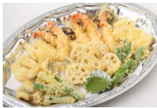
海鮮と季節野菜の天ぷら盛合せ Lサイズ ¥7,700