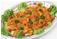
白身魚のタイ風煮込み Sサイズ ¥3,300 Lサイズ ¥5,500