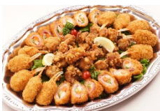
唐揚げ・カニ爪・野菜肉巻き Sサイズ ¥3,850 Lサイズ ¥6,600