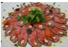
特製ローストビーフ オニオンソースorグレイビーソース Sサイズ ¥3,850 Lサイズ ¥6,600