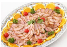
鴨肉のロースト 粒胡椒風味 Sサイズ ¥3,850 Lサイズ ¥6,600