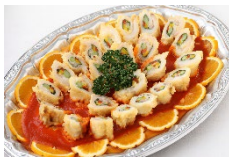
白身魚のアスパラ包み揚げ Sサイズ ¥3,850 Lサイズ ¥6,600