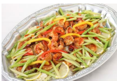
海老とアスパラガスの塩炒め バターライス添え Sサイズ ¥3,850 Lサイズ ¥6,600