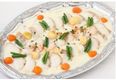
白身魚のポアレ クリームソース Sサイズ ¥3,300 Lサイズ ¥5,500

ワンウェイ容器にてお届けいたします。 メニュー内容は季節や食材の入手状況によって、予告なく変更する場合がございます。 数量の変更・キャンセルは、ご利用日の3営業日前(土日祝除く)までとなります。 期日を過ぎての変更・キャンセルは承れませんのでご了承ください。 お届け時間は11時~21時までの間1時間幅でご指定ください。(例12時~13時) 価格はすべて税込価格です。 SサイズはLサイズのおよそ半分量です。 お料理には使い捨ての紙トングを1皿につき1本お付けいたします。 その他、ご希望やご要望がございましたらご連絡ください。