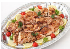
若鶏の山椒焼き Sサイズ ¥3,300 Lサイズ ¥5,500