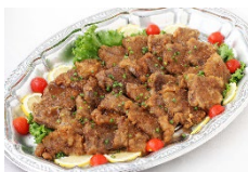
牛肉の竜田揚げ Sサイズ ¥3,850 Lサイズ ¥6,600