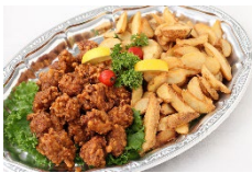
唐揚げ&フライドポテト Sサイズ ¥2,750 Lサイズ ¥4,400