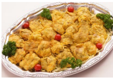
ポークピカタ バジルパスタ添え Sサイズ ¥2,750 Lサイズ ¥4,400