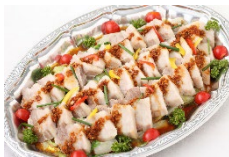
塩漬豚肉とレタス 特製ソース Sサイズ ¥3,300 Lサイズ ¥5,500