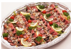
特製ローストビーフのカルパッチョ Sサイズ ¥3,850 Lサイズ ¥6,600