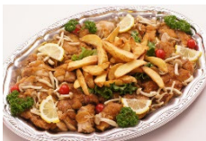
照り焼きチキン ポテト添え Sサイズ ¥2,750 Lサイズ ¥4,400