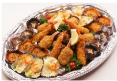
6種オードブル盛合せ Lサイズ ¥6,600