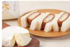
チーズメンチかつサンド

3切れ ..... 420円 (10%税込 462円) 6切れ ..... 825円 (10%税込 908円) 9切れ ..... 1,210円 (10%税込 1,331円) 18切れ ..... 2,400円 (10%税込 2,640円)