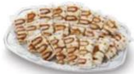
ヒレかつサンドオードブル

ミニヒレかつバーガー ..... 230円 (10%税込 253円) ミニメンチかつバーガー ..... 160円 (10%税込 176円) ミニエビかつバーガー ..... 240円 (10%税込 264円) 黒豚ミニメンチかつバーガー ..... 190円 (10%税込 209円) ミニポテココロかつバーガー ..... 170円 (10%税込 187円) ミニフィッシュかつバーガー ..... 210円 (10%税込 231円)