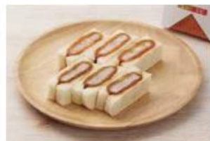
ミックスサンド(ヒレ3切れ・エビ3切れ)

3切れ ..... 450円 (10%税込 495円) 6切れ ..... 885円 (10%税込 974円)