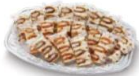
ミックスサンドオードブル

18パック ..... 3,800円 (10%税込 4,180円) 22パック ..... 4,650円 (10%税込 5,115円) 26パック ..... 5,500円 (10%税込 6,050円)