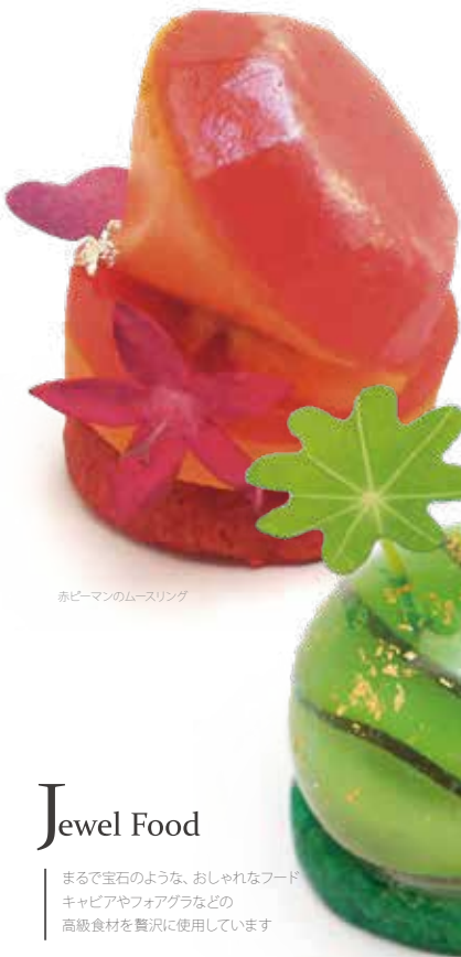
赤ピーマンのムースリング