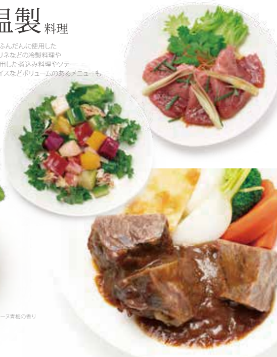
フォグラのテリーヌ青梅の香り

旬の素材をふんだんに使用した サラダやマリネなどの冷製料理や 肉や魚を使用した煮込み料理やソテー ペンネやライスなどボリュームのあるメニューも